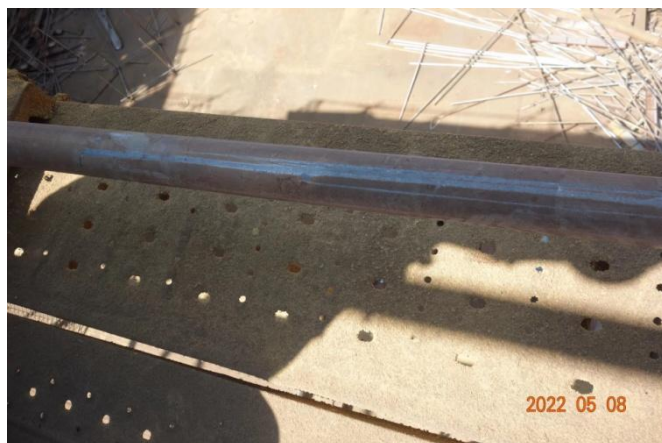
图 4 原固定于第 C、D 立杆上 6 米横杆的划痕

4. 脚手架南侧下方地面有 0.4 米*0.5 米见方的血迹，至北侧内架距离约 1.1 米，血迹附近有散开的五点式安全带 1 副（上有救援时剪切的痕迹）、扳手 1 把、散落的立杆和扣件若干。